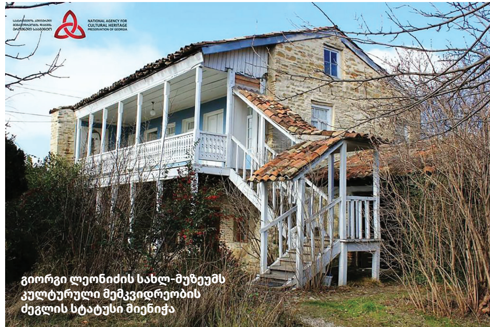
გიორგი ლეონიძის სახლ-მუზეუმს კულტურული მემკვიდრეობის ძეგლის სტატუსი მიენიჭა

კულტურისა და ძეგლთა დაცვის სამინისტრომ, მიზნობრივი პროგრამების ფარგლებში, მუნიციპალიტეტში შემდეგი პროექტები განახორციელა: დავით გარეჯის სამონასტრო კომპლექსი, დოდოს რქის ცენტრალური ტაძრის გადაუდებელი დაცვითი სამუშაოები (19 ათასი ლარი); უჯარმის ციხის ტერიტორია – არქეოლოგიური სამუშაოები (3 ათასი ლარი); დავით გარეჯის დოდოს რქის სამონასტრო კომპლექსი, ახალგაშენებული დარბაზული ეკლესიის რეაბილიტაცია და მოხატულობა (სულ – 47 ათასი ლარი); „კახეთის მხარის მოსწავლეები – კულტურული მემკვიდრეობის დესპანები“ (2,5 ათასი ლარი); წმინდა დოდო გარეჯელის სამონასტრო კომპლექსის არქეოლოგიური სამუშაოები (3 ათასი ლარი); კანარეთის სამების რეაბილიტაცია (30 ათასი ლარი); ჯვარპატიოსნის ეკლესიის სარეაბილიტაციო სამუშაოები (29,4 ათასი ლარი); უჯარმის ციხის სარეაბილიტაციო სამუშაოების I ეტაპი (28,5 ათასი ლარი); უჯარმის ციხე-ქალაქის რეაბილიტაცია-კონსერვაციის III ეტაპის სამუშაოები (436,8 ათასი ლარი); დავით გარეჯის დოდოს რქის სამონასტრო კომპლექსის დარბაზული ეკლესიის კედლის მოხატულობის საკონსერვაციო სამუშაოები (40 ათასი ლარი); უჯარმის ციხე-ქალაქის რეაბილიტაცია-კონსერვაციის IV ეტაპის სამუშაოები (285 ათასი ლარი). მიმდინარეობს უჯარმის ციხე-ქალაქის რეაბილიტაცია-კონსერვაციის V ეტაპის სამუშაოები (500 ათასი ლარი). უჯარმის ისტორიულ მუზეუმ-ნაკრძალს, 2015-2021 წლებში, საერთო ჯამში, 65 133 დამთვალიერებელი სტუმრობდა.