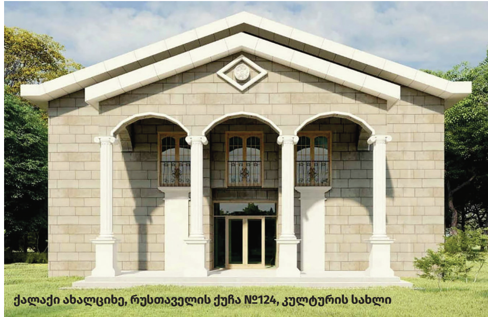
ქალაქი ახალციხე, რუსთაველის ქუჩა №124, კულტურის სახლი

2014-2021 წლებში განხორციელდა კულტურის ობიექტების მშენებლობა-რეაბილიტაციის პროექტები: კულტურის სახლების რეაბილიტაცია სოფლებში – ანყური, სხვილისი, ზიკილია, ფერსა და დიდი პამაჯი; ქ. ვალეს კულტურის სახლისა და მიმდებარე ტერიტორიის კეთილმოწყობა; სოფ. მუსხის სასოფლო კლუბისა და ბიბლიოთეკის