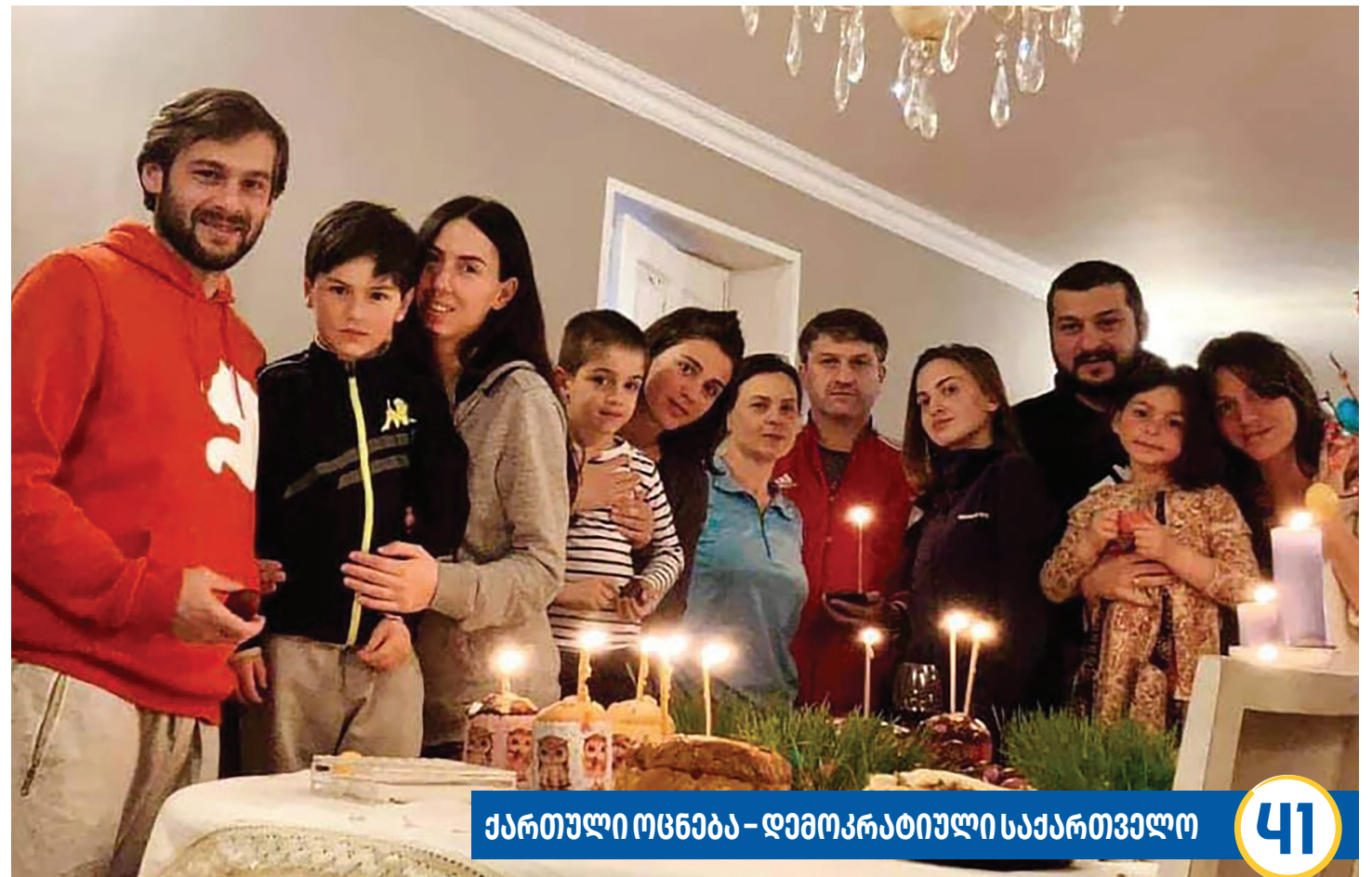
ქართული ოცნება – დემოკრატიული საქართველო

– ჩემი უპირატესობაა, ვარ სახელისუფლებო გუნდის კანდიდატი, ძალიან ძლიერი და ადამიანებზე ორიენტირებული გუნდის წევრი. მათი მხარდაჭერა მექნება და ეს მცირე ძალა არაა მმართველისათვის. გარდა ამისა, რითაც ცხოვრებამ გამანებივრა ისაა, რომ ბევრი კარგი მეგობარი მყავს, ბევრი გულშემატკივარი. ჩემს პირად ადამიანურ რესურსსაც გამოვიყენებ მშობლიური კუთხის საკეთილდღეოდ. მჯერა, ცაგერის მოსახლეობა მხარს დამიჭერს, 2 ოქტომბერს, ადგილობრივი თვითმმართველობის არჩევნებში გავიმარჯვებ და ცაგერის განვითარებაში მნიშვნელოვან წვლილს შევიტან.