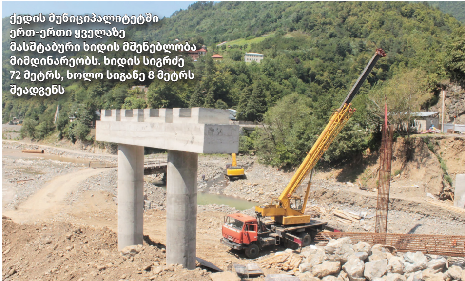
ქედის მუნიციპალიტეტში ერთ-ერთი ყველაზე მასშტაბური ხიდის მშენებლობა მიმდინარეობს. ხიდის სიგრძე 72 მეტრს, ხოლო სიგანე 8 მეტრს შეადგენს

საგზაო ინფრასტრუქტურა; სოფ. ქვედა მახუნცეთში, ანჭესის დასახლებაში, აშენდა და მოეწყო ტურისტული ცენტრი და პარკირების ზონა; ცივასულას, ზენდიდისა და კავიანის ციხეებზე მოეწყო ტურისტული ინფრასტრუქტურა; კეთილმოეწყო ბზუბზუს ჩანჩქერის, გოდერძის ჩანჩქერის, მინის ხიდისა და წონიარისის თაღოვანი ხიდის მიმდებარე ტერიტორია;