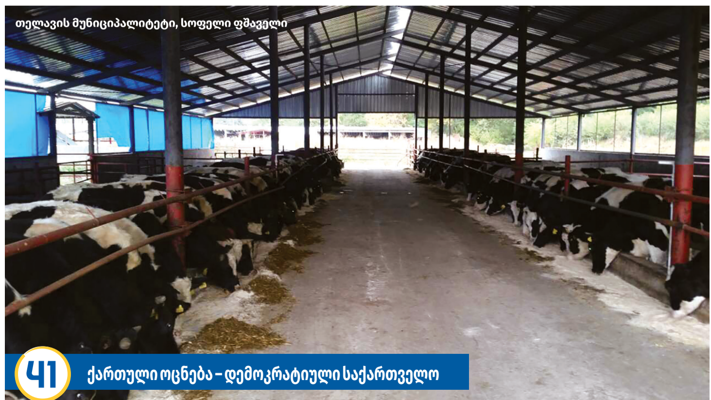
თელავის მუნიციპალიტეტი, სოფელი ფშაველი

თელავის მუნიციპალიტეტში, 2013-2021 წლებში, გაზიფიცირებულია ჯამურად 1 287 აბონენტი. 2013-2017 წლებში, 4 279 აბონენტს დაუმონტაჟდა