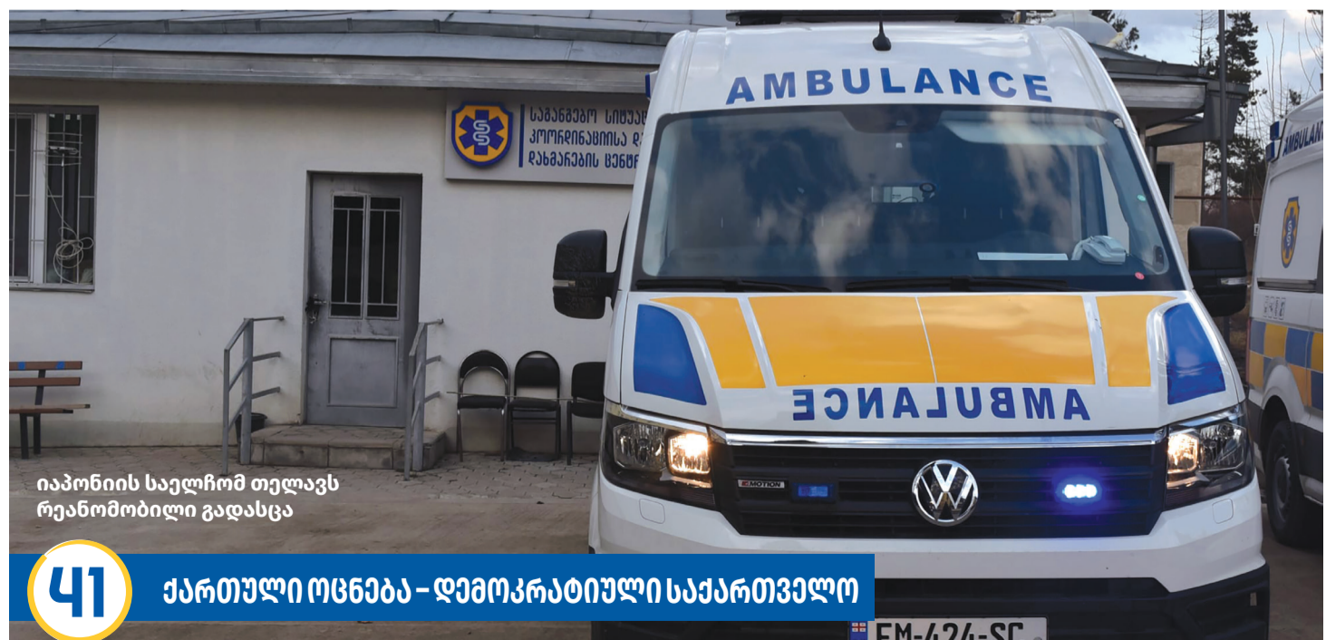
იაპონიის საელჩომ თელავს რეანომობილი გადასცა