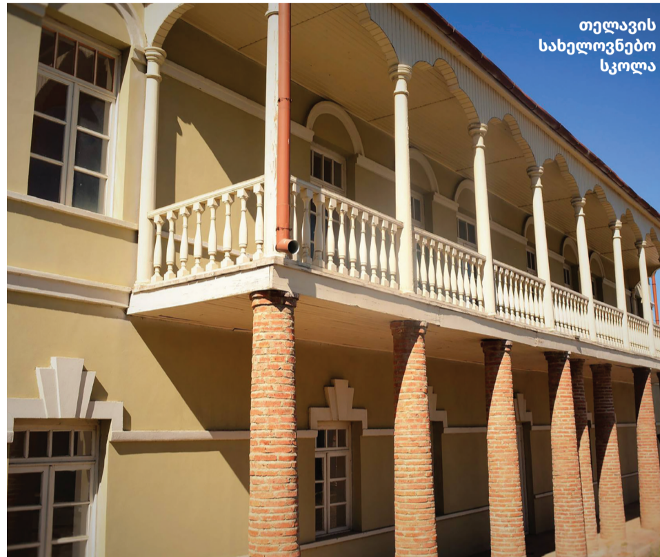
თელავის სახელოვნებო სკოლა

პირველი სამუსიკო სკოლის ბაზაზე დაფუძნდა შ. დავითაშვილის სახელობის ნორჩ მუსიკოსთა საერთაშორისო ფესტივალ-კონკურსი. განხორციელდა და გრძელდება ღონისძიებები, რომელთა შორის აღსანიშნავია საერთაშორისო პროექტები და, პანდემიური ვითარებიდან გამომდინარე, დისტანციური ღონისძიებები. 2018 წელს დაფუძნდა ყოველწლიური ფესტივალი „ხელოვნება და შემოქმედება“ (29 900 ლარი). 2018 წლიდან დღემდე, ყოველწლიურად, თელავის მუნიციპალიტეტის წარჩინებულ 30 მოსწავლეს შესაძლებლობა აქვს, კულტურულ-საგანმანათლებლო პროგრამის ფარგლებში, მონაწილეობა მიიღოს გონიოს არქეოლოგიურ ბანაკში , აფსაროსის მუზეუმ-ნაკრძალში (45 500 ლარი). განხორციელდა პროექტები: „კახეთის მხარის მოსწავლეები – კულტურული მემკვიდრეობის დესპანები“ (2,6 ათასი ლარი); საქართველოს ცენტრსა და რეგიონებში ეთნიკურ უმცირესობათა შემოქმედებითი აქტივობების ხელშესაწყობად მოეწყო ქუთთ-იეზიდ მხატვართა და ტრადიციული ხელოვნების ოსტატთა ნამუშევრების გამოფენა თელავში, თბილისსა და ბათუმში (7, 8 ათასი ლარი). 2020 წელს, კულტურისა და ძეგლთა დაცვის სამინისტროს ხელშეწყობით, თელავის მუნიციპალიტეტის სოფელ თეთრიწყლებში, მაღალმთიანი რეგიონებისთვის კულტურული ცხოვრების ხელმისაწვდომობის მიზნით, გაიმართა მოზარდ მაყურებელთა თეატრის წარმოდგენა სასწავლო წლის დაწყების აღსანიშნავად.