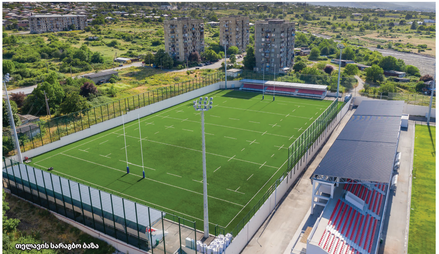
თელავის სარაგბო ბაზა

2015 წელს დაიწყო და ამჟამად ექსპლოატაციაში შესვლის პროცესშია, თელავის ორდარბაზიანი მულტიფუნქციური კომპლექსი, პროექტის ღირებულება 45 მლნ 500 ათასი ლარია და საქართველოს კულტურის, სპორტისა და ახალგაზრდობის საქმეთა სამინისტროს დაფინანსებით განხორციელდა. სპორტისა და ახალგაზრდობის საქმეთა სამინისტროსთან შეთანხმებით, სპორტულმა ფედერაციებმა, თელავის