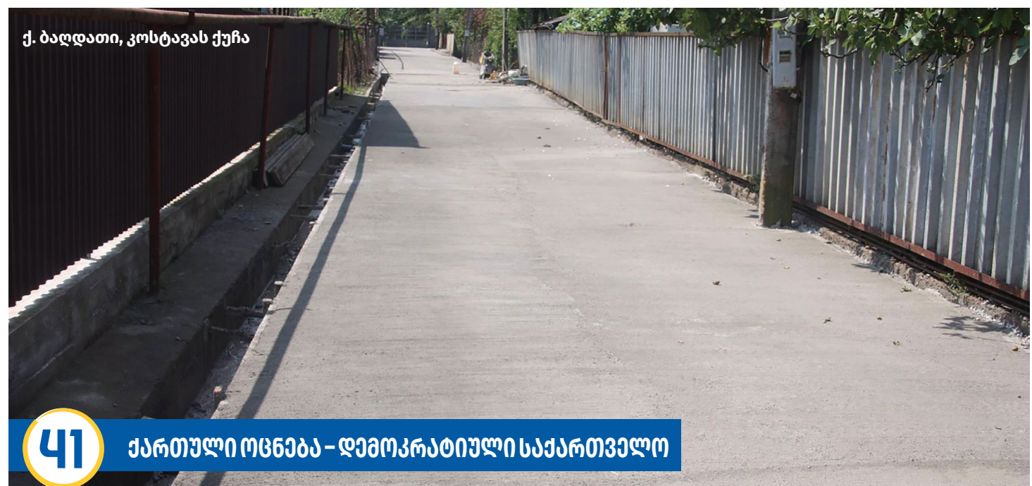
ქ. ბაღდათი, კოსტავას ქუჩა

ტურიზმის განსავითარებლად, ბაღდათში განხორციელდა ტურისტული რესურსების სრული ინვენტარიზაცია. ადგილობრივი მენარმეების ხელშეწყობის და ტურისტული სერვისის გაუმჯობესების მიზნით, რეგიონში ბოლო წლების მანძილზე ჩატარდა 25-მდე სხვადასხვა ტრენინგი, ჯამში გადამ-