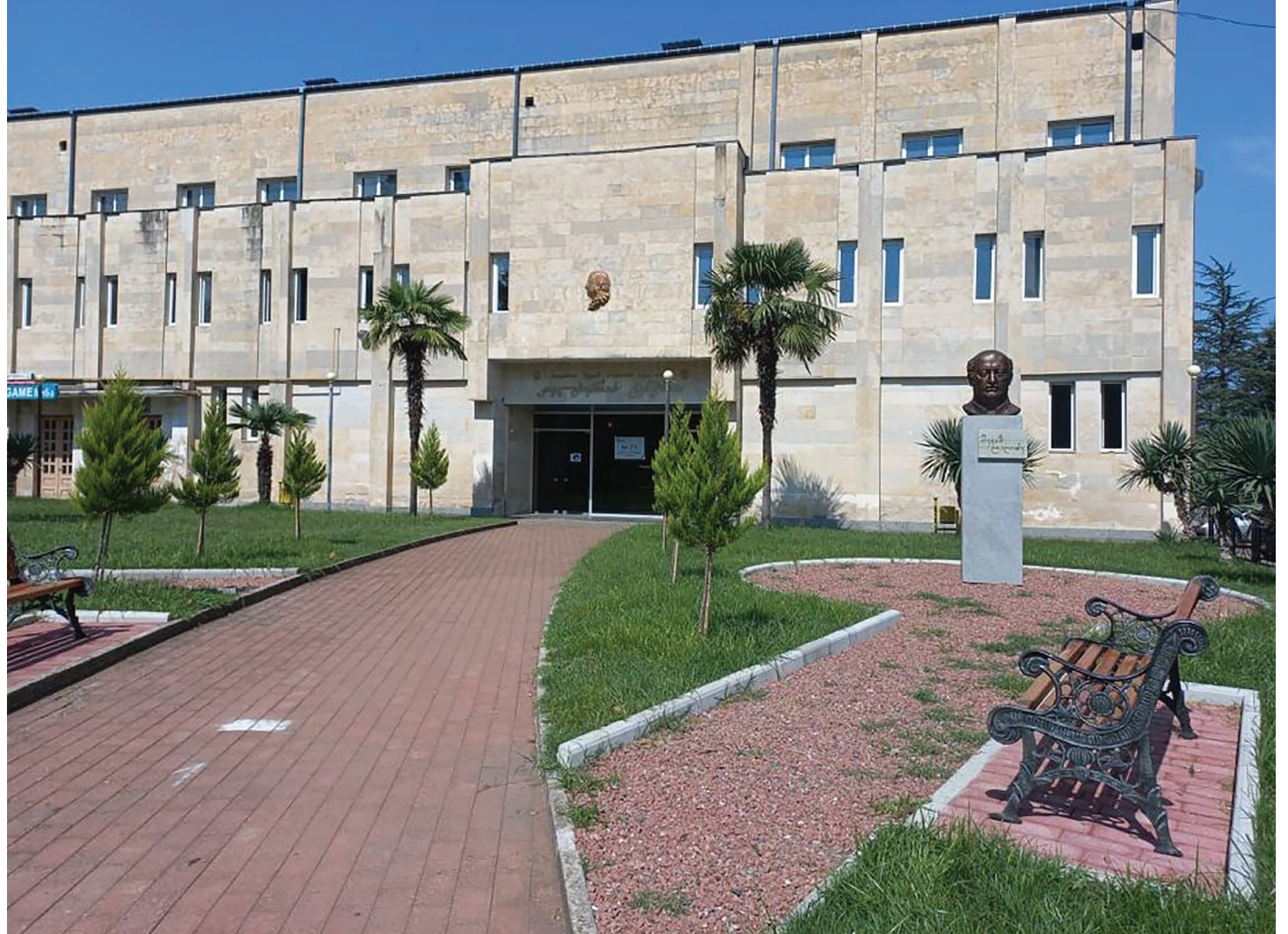
რევაზ ლაღიძის სახელობის კულტურის ცენტრი

საც საქართველოს ისტორიულ ძეგლთა დაცვისა და გადარჩენის ფონდი აფინანსებს.