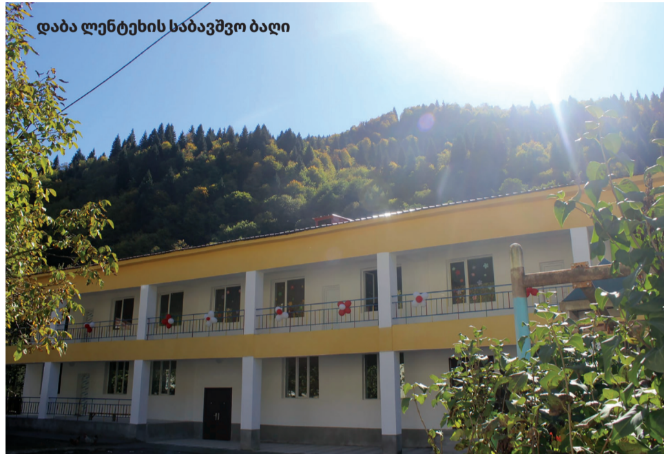
დაბა ლენტეხის საბავშვო ბაღი

განათლების სისტემის განვითარება „ქართული ოცნების“ ერთ-ერთი უმნიშვნელოვანესი პრიორიტეტი. 2012 წლის შემდეგ, საქართველოში განხორციელდა ფუნდამენტური სისტემური ცვლილებები მაღალი ხარისხის განათლების ხელმისაწვდომობის უზრუნველსაყოფად. მათ შორის, შეიქმნა განათლების სისტემის ფინანსური მდგრადობის უზრუნველყოფი საკანონმდებლო გარანტიები, დაიხვეწა ადრეული და სკოლაგარეშე აღზრდისა და განათლების სისტემის მართვითი მართვითი კანონმდებლობა, დადგინდა და დაინერგა ძირითადი სტანდარტები.