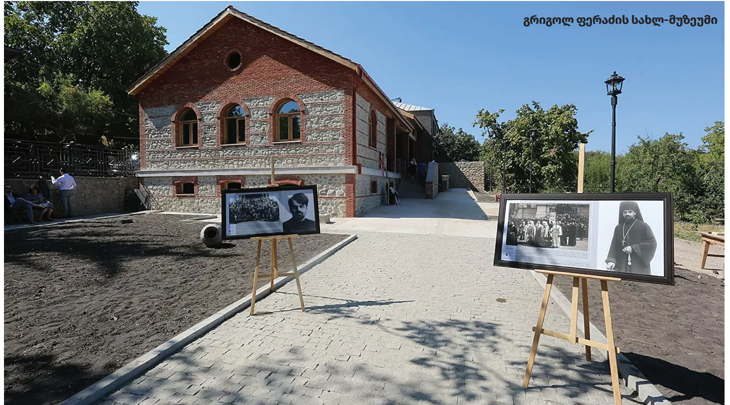
გრიგოლ ფერაძის სახლ-მუზეუმი

2020 წელს, 2013 წელთან შედარებით, მნიშვნელოვნად გაიზარდა მუნიციპალიტეტის ბიუჯეტიდან კულტურის სფეროს დაფინანსება. 2020 წელს კულ-