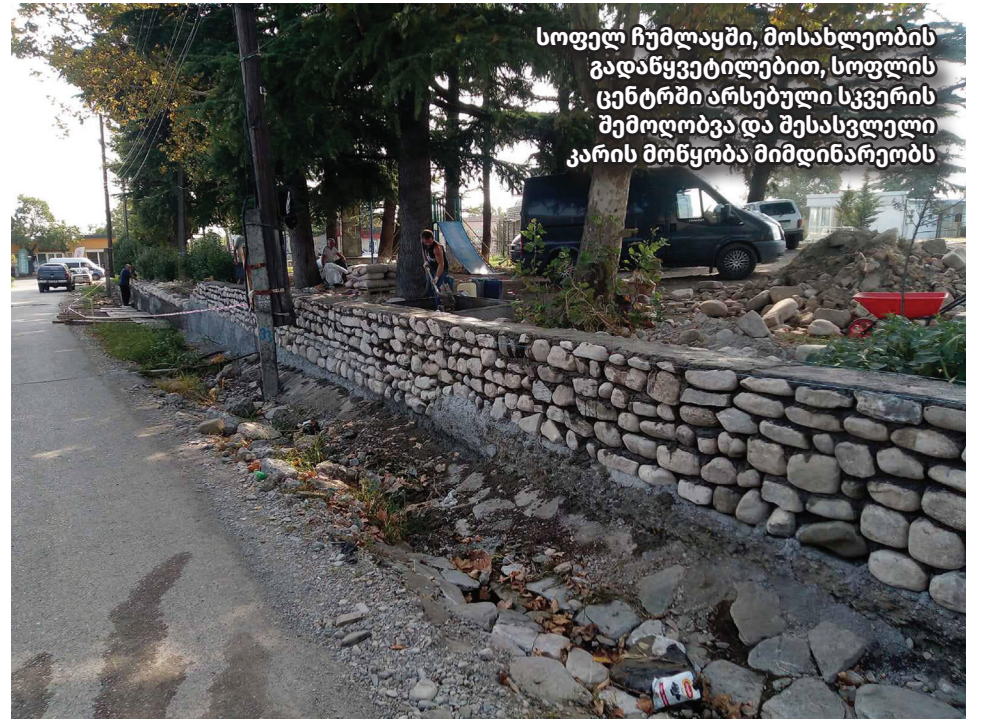
სოფელ ჩუმლაყში, მოსახლეობის გადანაცვლებით, სოფლის ცენტრში არსებული სკვერის შემოღობვა და შესასვლელი კარის მოწყობა მიმდინარეობს

2014-2020 წლებში, გურჯაანის წყალმომარაგებისა და საკანალიზაციო ქსელის განვითარებაზე, მუნიციპალური და ცენტრალური ბიუჯეტიდან, ჯამურად 9,5 მლნ ლარზე მეტი დაიხარჯა. ხელისუფლების გეგმით, 2021-2023 წლებში, ამ მიზნით, დამატებით 70 მლნ ლარზე მეტი დაიხარჯება. გურჯაანში მიმდინარეობს ან იგეგმება წყალმომარაგების შემდეგი პროექტები: ბაკურციხისა და კარდენახის წყალმომარაგების სისტემის, ქ. გურჯაანის სერვისცენტრის რეაბილიტაციისა და ლაბორატორიის მოწყობის პროექტირება-მშენებლობა (ჯამურად 18 400 000.00 ლარი სიღნაღის პროექტებთან ერთად); ქ. გურჯაანის წყალარინების სისტემისა და გამწმენდი ნაგებობის მშენებლობა (750 000 ლ); ქ. გურჯაანის წყალარინების სისტემისა და წყალმომარაგების მაგისტრალური მილის რეაბილიტაცია (3 699 924 ლ); ჯიმიტისა და ნანიანის წყალმომარაგების სისტემის პროექტირება/მშენებლობა (6 193 333 ლ); არაშენდას, დარჩეთისა და ქოდალოს წყალმომარაგების სისტემის რეაბილიტაცია (6 699 915 ლ); ვეჯინისა და კოლაგის წყალმომარაგების სისტემის რეაბილიტაცია/მშენებლობა (11 999 999 ლ); ჭანდარისა და ძირკოკის წყალმომარაგების სისტემის რეაბილიტაცია/მშენებლობა (8,199,933 ლ); სოფელ გურჯაანის წყალმომარაგების სისტემის რეაბილიტაცია/მშენებლობა (6 345 000 ლ); კაჭრეთისა და ზემო კაჭრეთის წყალმომარაგების რეაბილიტაცია/მშენებლობა (7,700,000 ლ);