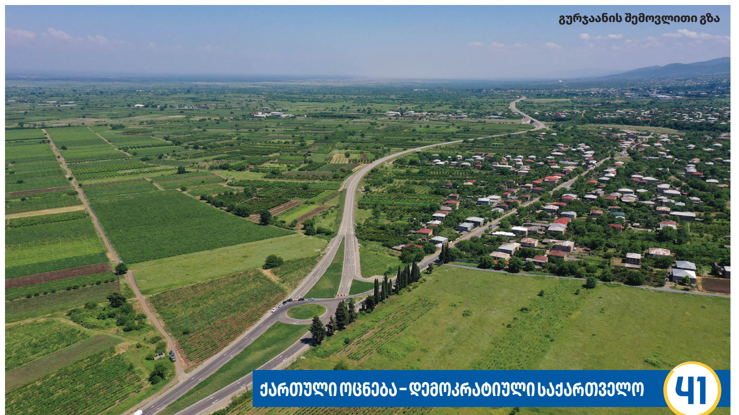
გურჯაანის შემოვლითი გზა

ქართული ოცნება – დემოკრატიული საქართველო