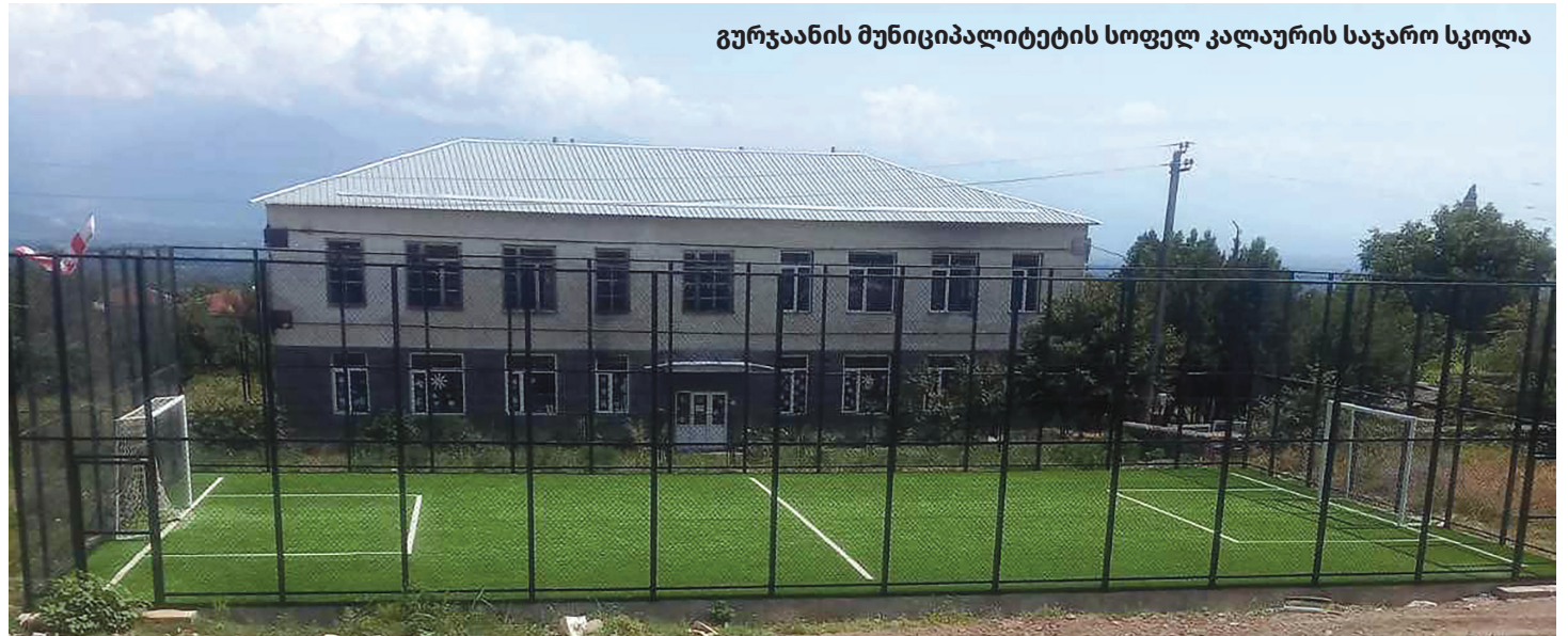
გურჯაანის მუნიციპალიტეტის სოფელ კალაურის საჯარო სკოლა

განათლების სისტემის განვითარება „ქართული ოცნების“ ერთ-ერთი უმნიშვნელოვანესი პრიორიტეტი. 2012 წლის შემდეგ, საქართველოში განხორციელდა ფუნდამენტური სისტემური ცვლილებები მაღალი ხარისხის განათლების ხელმისაწვდომობის უზრუნველსაყოფად. მათ შორის, შეიქმნა განათლების სისტემის ფინანსური მდგრადობის უზრუნველყოფი საკანონმდებლო გარემოები, დაიხვეწა ადრეული და სკოლაგარეშე აღზრდისა და განათლების სისტემის მარაგშენიშნავი კანონმდებლობა, დადგინდა და დაინერგა ძირითადი სტანდარტები.