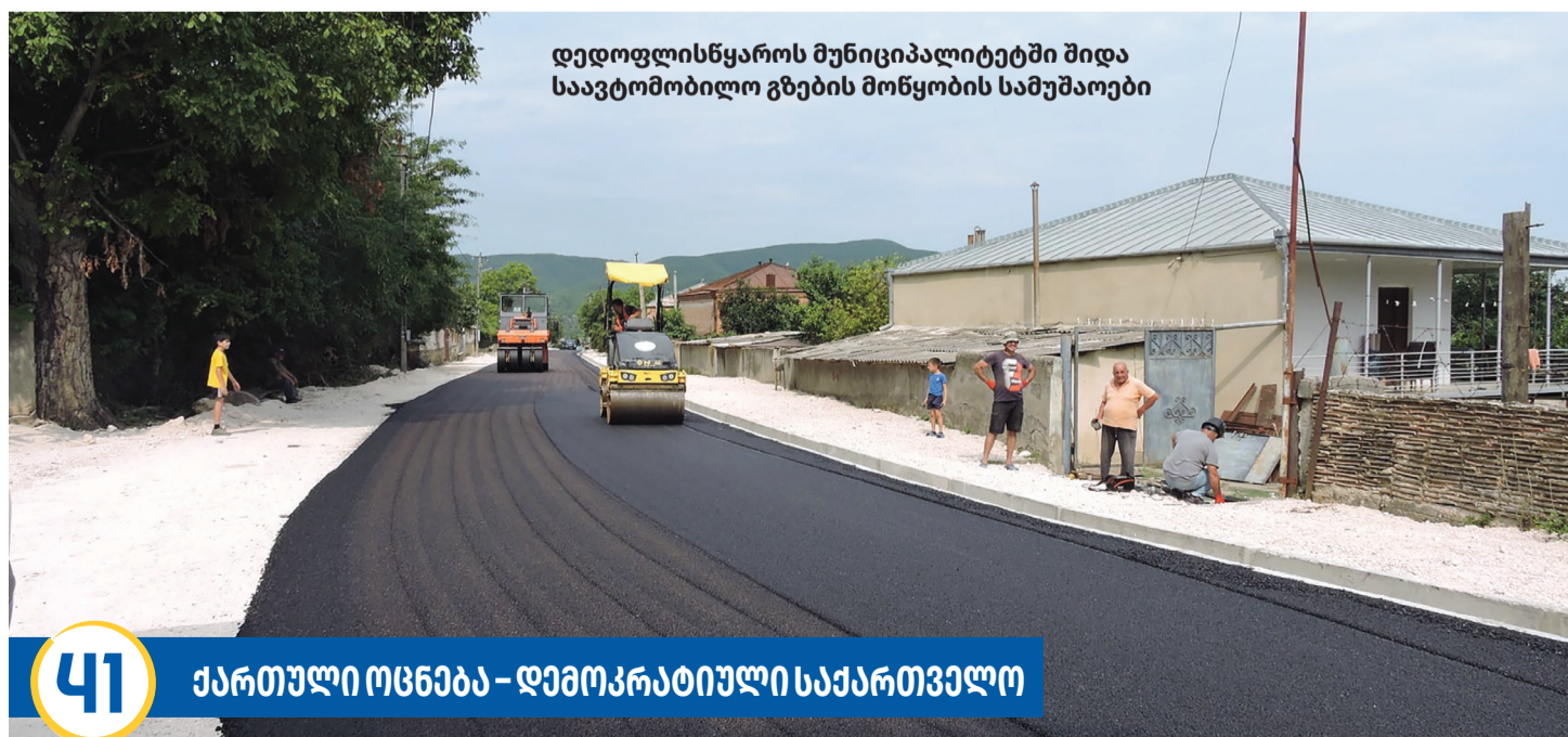
დედოფლისწყაროს მუნიციპალიტეტში შიდა საავტომობილო გზების მოწყობის სამუშაოები

ტურიზმის განსავითარებლად, 2014 წელს დედოფლისწყაროში ჩატარდა ტურისტული რესურსების სრული ინვენტარიზაცია. 2013-2021 წლებში, მუნიციპალიტეტის ტერიტორიაზე განხორციელდა რამდენიმე პროექტი : ტურისტული მარშრუტების კვლევა; ხუთი სხვადასხვა ტიპისა და სირთულის მარშრუტის შემუშავება (საფეხმავლო,