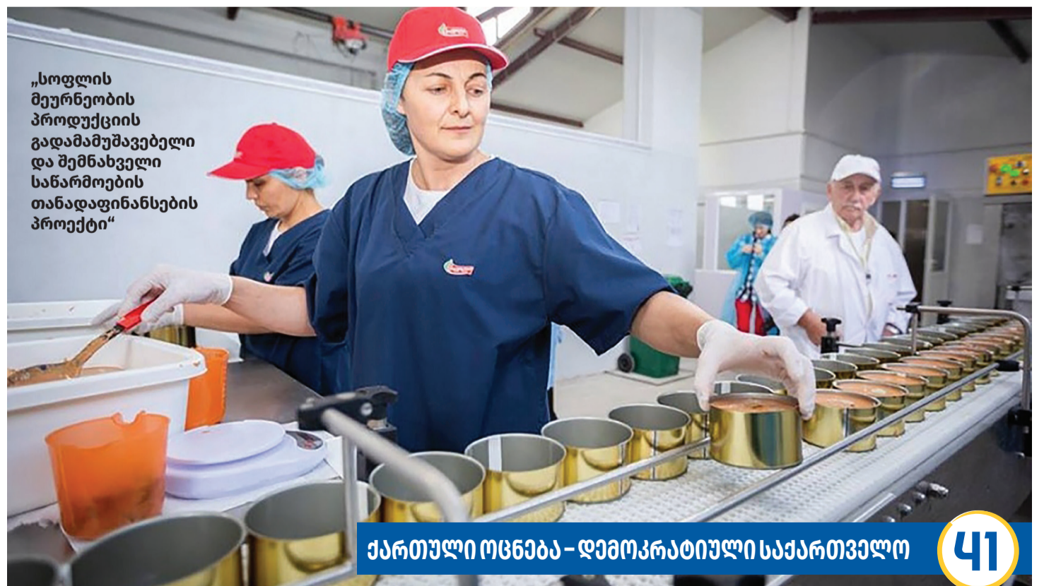
„სოფლის მეურნეობის პროდუქციის გადამამუშავებელი და შემნახველი საწარმოების თანადაფინანსების პროექტი“

ქართული ოცნება – დემოკრატიული საქართველო