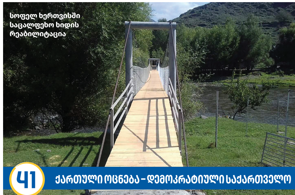
სოფელ ხერთვისში საცალფეხო ხიდის რეაბილიტაცია

ასპინძის მუნიციპალიტეტში, 2013-2021 წლებში, გაზიფიცირებულია ჯამურად 782 აბონენტი. 2024 წელს სრულად დასრულდება ასპინძის მუნიციპალიტეტის სოფლების გაზიფიცირება. ელექტროენერგიის ინდივიდუალური მრიცხველი, რითაც მოსახლეობის ელექტროენერგიით უზრუნველყოფის საკითხი სრულად მოწესრიგდა.