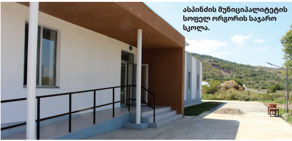
ასპინძის მუნიციპალიტეტის სოფელ ორგორის საჯარო სკოლა.

ნიციპალური საბავშვო ბაღი, მათგან 2 – დაბა ასპინძაში, ხოლო 2 – სოფლად), სადაც 2021 წლისთვის ირიცხება 420 აღ-საზრდელი (2013 წელს – 280), დასაქმებულია 33 აღმზრდელი, 16 აღმზრდელის თანაშემწე და 3 ექთანი. 2013 წლის შემდეგ საქართველოს მასშტაბით საბავშვო ბაღები გახდა უფასო. თითოეულ აღსაზრდელზე კვების თანხა 0.9-დან 2,70 ლარამდე გაიზარდა, ამით მნიშვნელოვნად გაფართოვდა და სრულფასოვანი გახდა ბავშვების კვების რაციონი. სასკოლო მზაობის პროგრამა დანერგილია 5 სააღმზრდელო ჯგუფში, სადაც 100 ბავშვი ირიცხება.