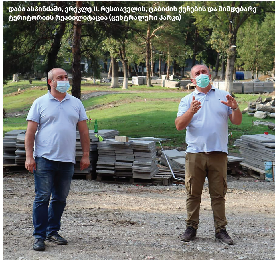
დაბა ასპინძაში, ერუკლე II, რუსთაველის, ტაბიძის ქუჩების და მიმდებარე ტერიტორიის რეაბილიტაცია (ცენტრალური პარკი)

მომდევნო წლებში გაგრძელდება სოფლის მეურნეობის ხელშეწყობის პროგრამები, რაც, მომდევნო 4 წლის განმავლობაში, მუნიციპალიტეტში რამდენიმე ასეულ ახალ სამუშაო ადგილს შექმნის და სოფლის მეურნეობაში დასაქმებული ადამიანების შემოსავლების ზრდას უზრუნველყოფს;