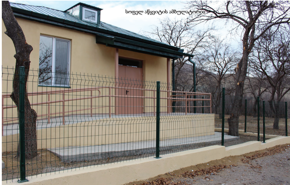
სოფელ აწყვიტის ამბულატორია

„ქართული ოცნებისთვის“ უმთავრესი ღირებულება არის ადამიანი, ხოლო საქმიანობის უმნიშვნელოვანესი პრინციპი – ადამიანზე, მის ღირსებაზე, სიცოცხლეზე და ჯანმრთელობაზე ზრუნვა. ხარისხიანი და საყოველთაოდ ხელმისაწვდომი, სოციალური სამართლიანობის პრინციპზე დაფუძნებული ჯანმრთელობის დაცვის სისტემის შენარჩუნება და შემდგომი განვითარება „ქართული ოცნების“ ერთ-ერთი უმთავრესი პრიორიტეტი.