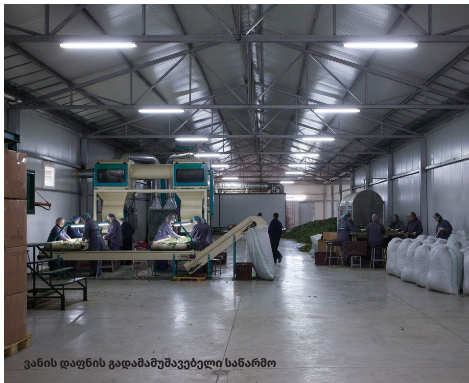
ვანის დაფნის გადამამუშავებელი საწარმო