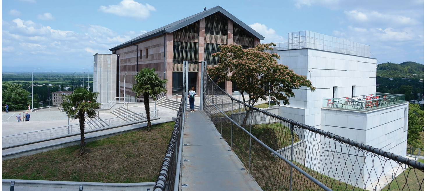
ვანის განახლებული არქეოლოგიური მუზეუმი

ჯამურად, 657,2 ათასი ლარი დაიხარჯა. მათ შორის დაფინანსდა: ქ. ვანის კულტურის ცენტრის კაპიტალური რემონტი ( 2014 წელი, პირველი ეტაპი – 337,3 ათასი ლარი; 2015 წელი, მეორე ეტაპი – 271 ათასი ლარი), შუამთის თემში კულტურის სახლთან გარეგანათების მოწყობა; ქ. ვანის კულტურის სახლის რეაბილიტაცია; ქ. ვანის ცენტრალური ბიბლიოთეკის მისასვლელი გზისა და მიმდებარე ტერიტორიის კეთილმოწყობა; სოფ. შუამთასა და სოფ. ჭყვიშში გარეგანათების მოწყობა გალაკტიმადე ტიციან ტაბიძეების სახლ-მუზეუმამდე; გალაკტიმადე და ტიციან ტაბიძეების სახლ-მუზეუმის მემორიალური შენობის რეკონსტრუქციის საპროექტო-სახარჯთაღრიცხვო დოკუმენტაციის შედგენა. 2017-2018 წლებში აშენდა კალისტრატე ცინცაძის მუზეუმი. მშენებლობა მუნიციპალური განვითარების ფონდმა დააფინანსა.