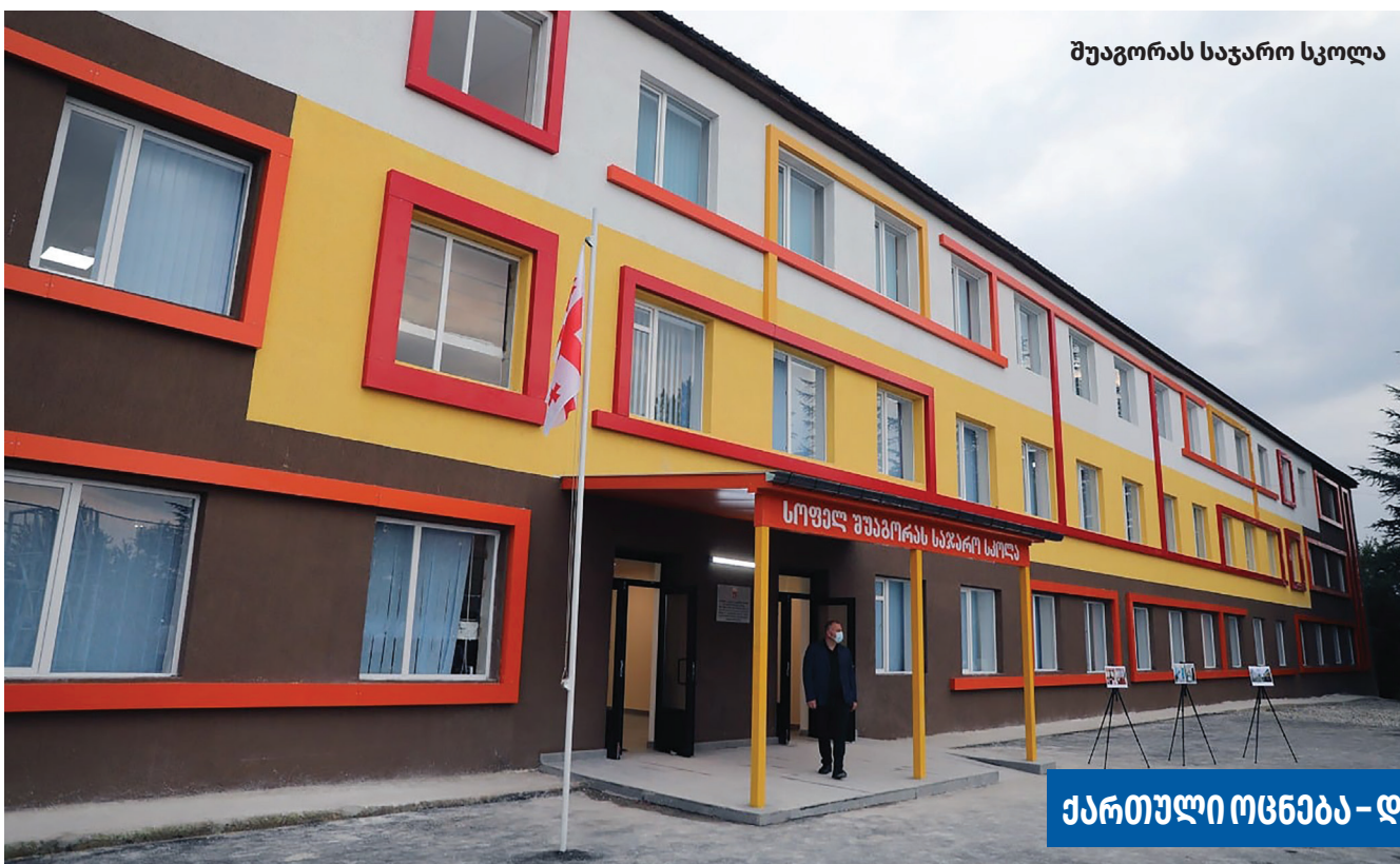
შუაგორას საჯარო სკოლა