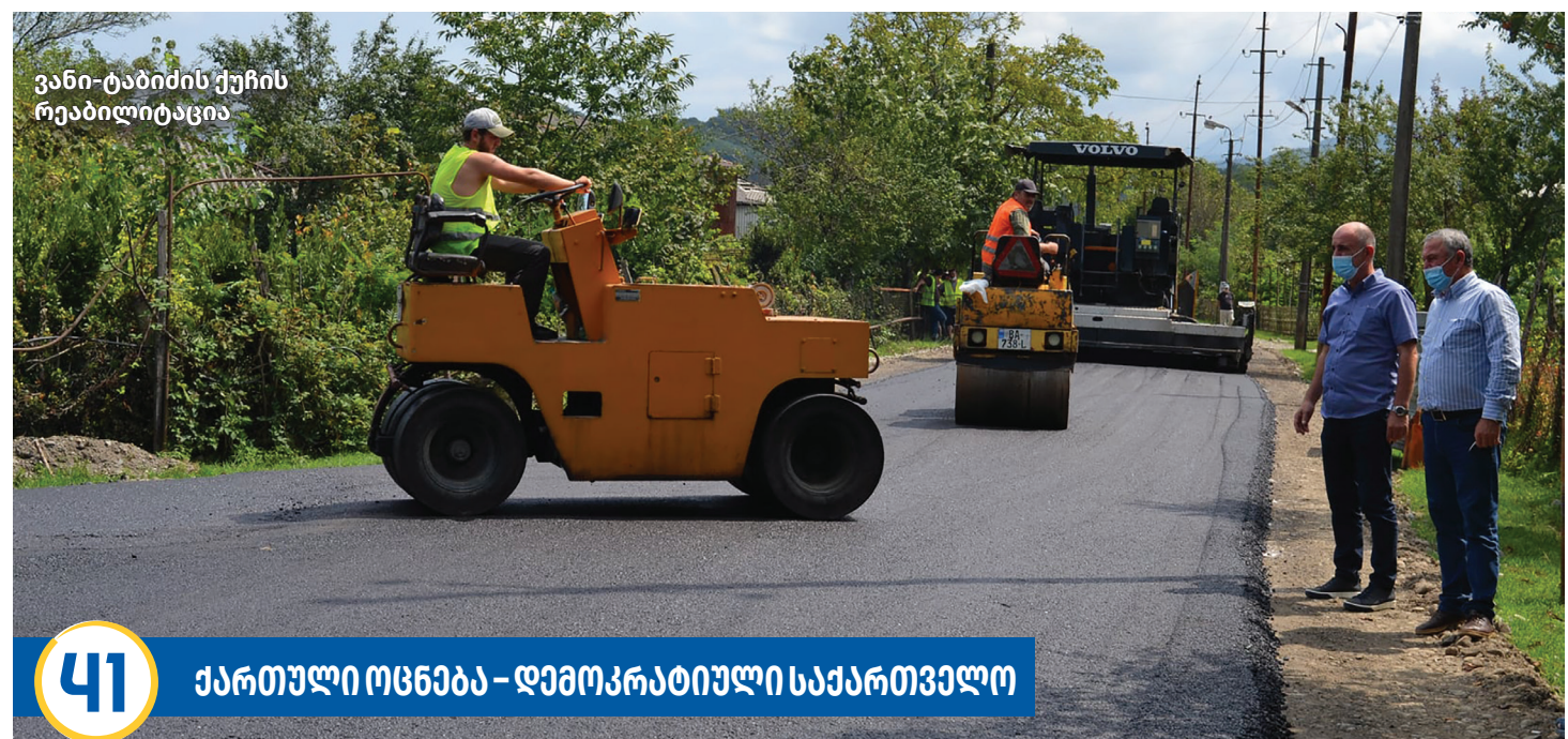
ვანი-ტაბიძის ქუჩის რეაბილიტაცია

ტურიზმის განსავითარებლად, 2014 წელს, ვანში, ჩატარდა ტურისტული რესურსების სრული ინვენტარიზაცია. 2016 წლიდან ხორციელდება ახალი ტურისტული მარშრუტების კვლევისა და დაგეგმვის პროექტი.